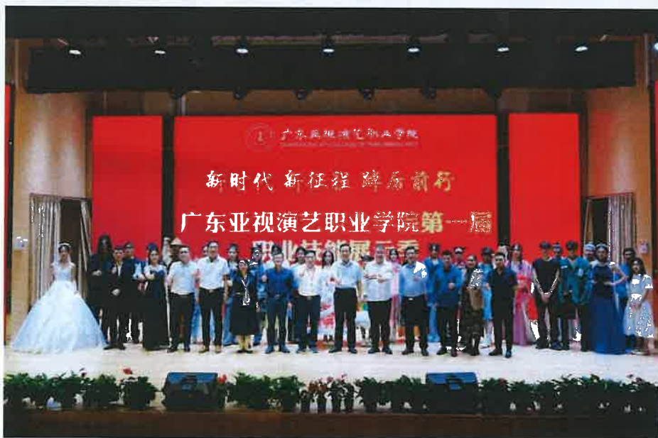
图：广东亚视演艺职业学院职业技能展示季

学校隆重举办以“新时代、新征程、踔厉前行”为主题的职业技能展示季活动。各专业以专场演出的形式，充分展示了职业教育发展的丰硕成果，展现师生奋发有为的精神风貌和精湛的职业技能，在教学和备赛中对接行业岗位需求，以成果为导向，以大赛为风向标，重构教学内容，改革教学方法，切实将“以赛促教、以赛促学、以赛促改、以赛促建”的理念融于教育教学过程中。