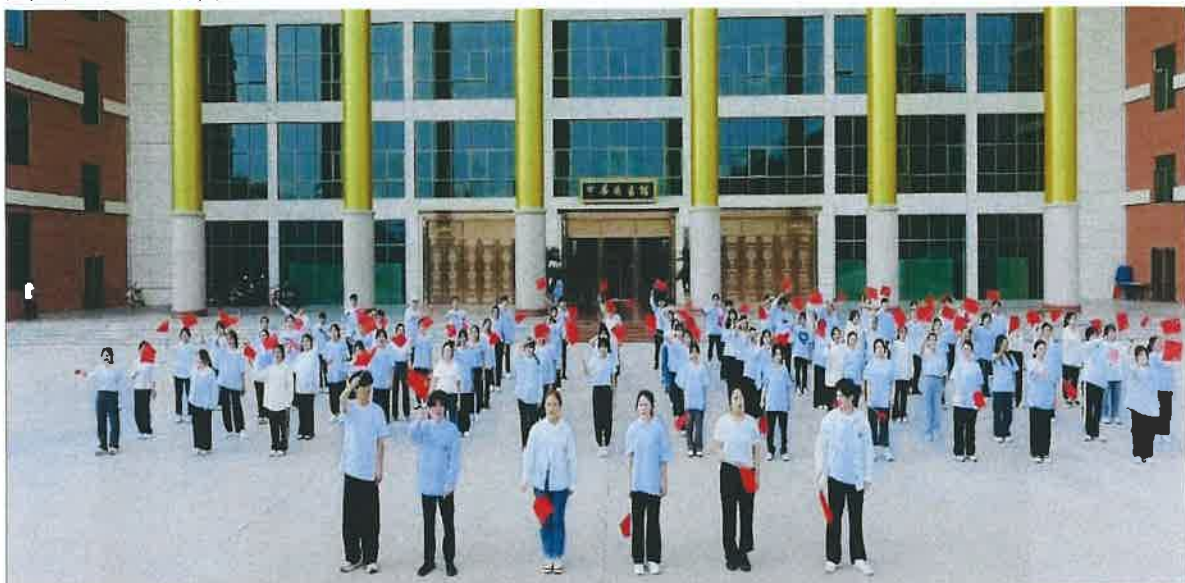
图：《百年追梦跟你走》主题快闪活动 MV 拍摄

学校领导、校团委聚焦党的二十大，凝聚青年力量，充分发挥学生专业优势，举办以“喜迎二十大 永远跟党走 奋进新征程”为主旋律的爱国摄影展、舞蹈、合唱大赛等系列活动，开展多主题、多样化的艺术展演活动。同时，精心挑选 120 名学生配合肇庆市委宣传部完成《百年追梦跟你走》主题快闪活动 MV 拍摄，为学习宣传党的二十大精神贡献青春力量。